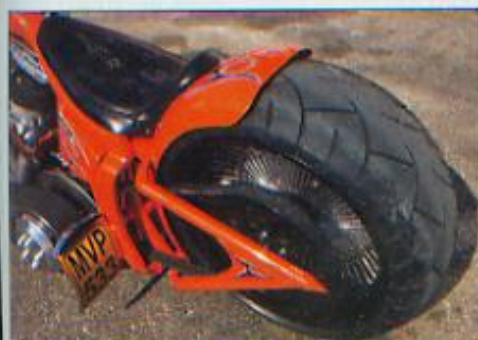
■ De achterbrug en achterspatbord zijn eveneens eigen creaties. De achteras bouten zijn weggewerkt achter covers. Rob van Leather Customs maakte het zadel