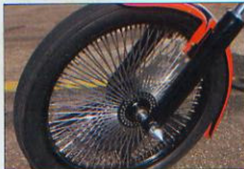
■ Zowel vóór als achter 120 spaaks velgen. De voorvelg is een omgebouwde crossmotorvelg; de achtervelg is een omgebouwde autovelg waaromheen een 280 achterband is gelegd