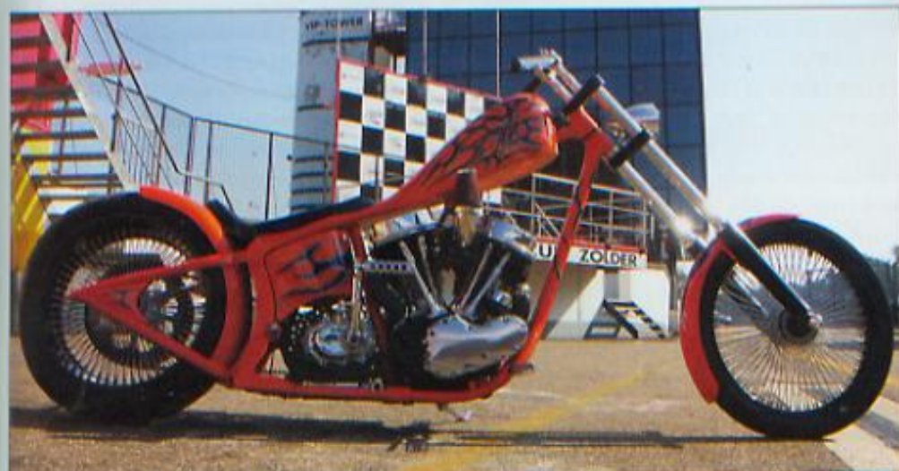
■ Ondanks gebruik van 'nieuwe' onderdelen is de motor een smaakvolle ode aan de gloriejijd van de chopper